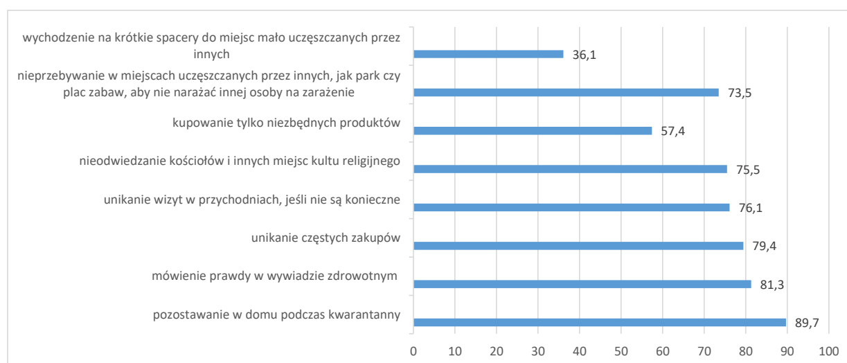
Wykres 1. Troska o dobro wspólne w sytuacji epidemiologicznej, w procentach

W opinii respondentów troska o dobro wspólne w trwającej sytuacji epidemiologicznej objawiała się przede wszystkim pozostawaniem w domu podczas kwarantanny domowej (89,7%). Warto zauważyć, że mimo kar pieniężnych – nawet do 30 tysięcy złotych za jej nieprzestrzeganie (INFOR, 2020) – są nadal osoby, które potencjalnie narażają innych na chorobę czy nawet śmierć. Policja potwierdza, że powodami łamania przepisów są między innymi chęć wyjścia na spacer, zorganizowanie imprezy czy chęć wyjazdu do Wielkiej Brytanii w celach zarobkowych (Policja.pl, 2020).