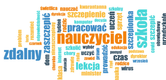
Rys. 1. Słowa kluczowe – hasła najczęściej pojawiające się w postach i komentarzach z grudnia 2022 roku

Wraz z początkiem grudnia w dyskusjach nauczycielskich powrócił więc wątek nauczania zdalnego i jego różnych aspektów. Poniższa chmura słów prezentuje główne hasła pojawiające się w tych dyskusjach.